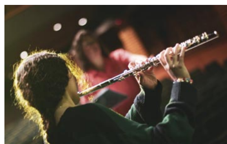
Académie (pluridisciplinaire)

Rue du Saule, 1 secretariat@academie-jette.be www.academie-jette.be 0490.52.27.51