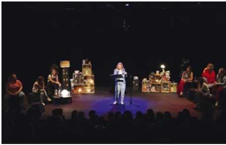
Les Confidentielles

Rue G. Van Huynegem 30-32 Inscriptions lerayonvert@skynet.be www.lerayonvert.be 0498.63.75.97