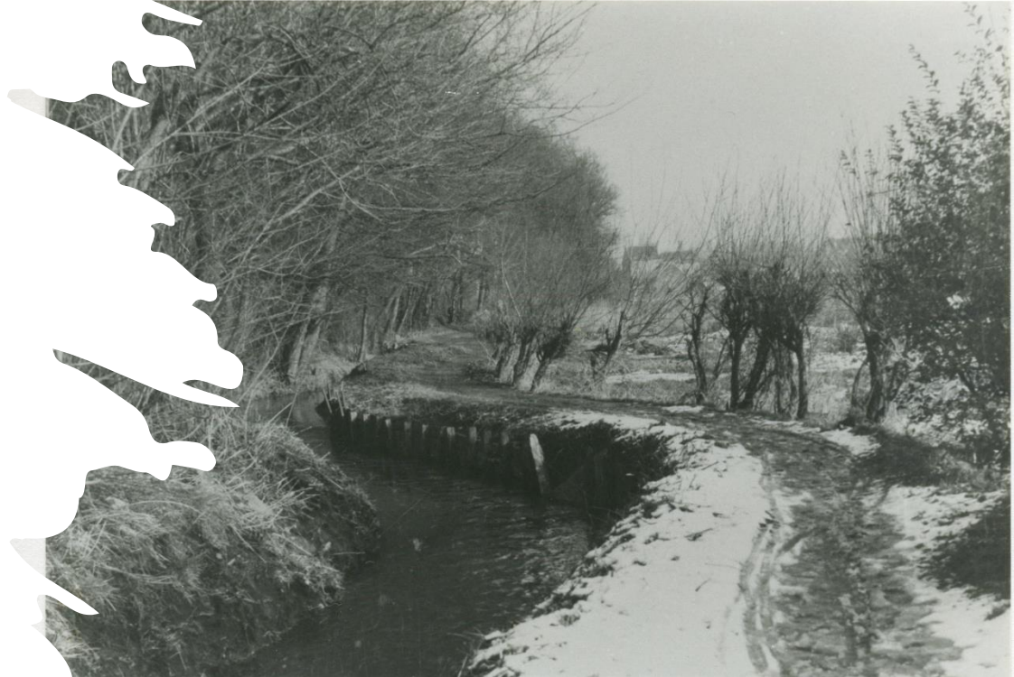
De Molenbeek vòòr 1951