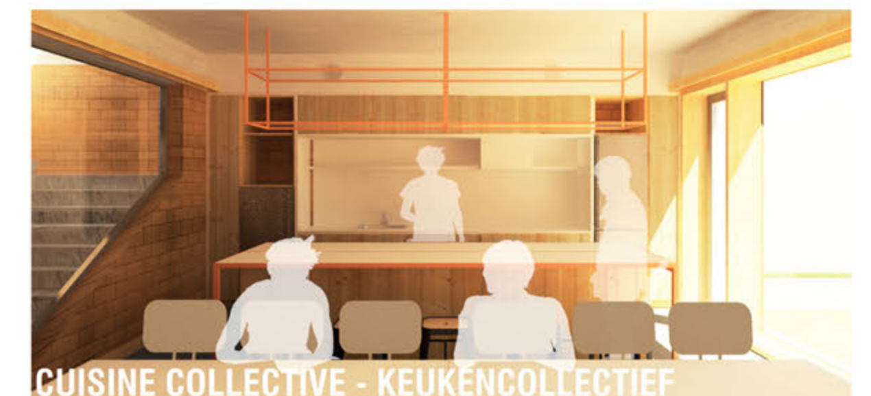
CUISINE COLLECTIVE - KEUKENCOLLECTIEF