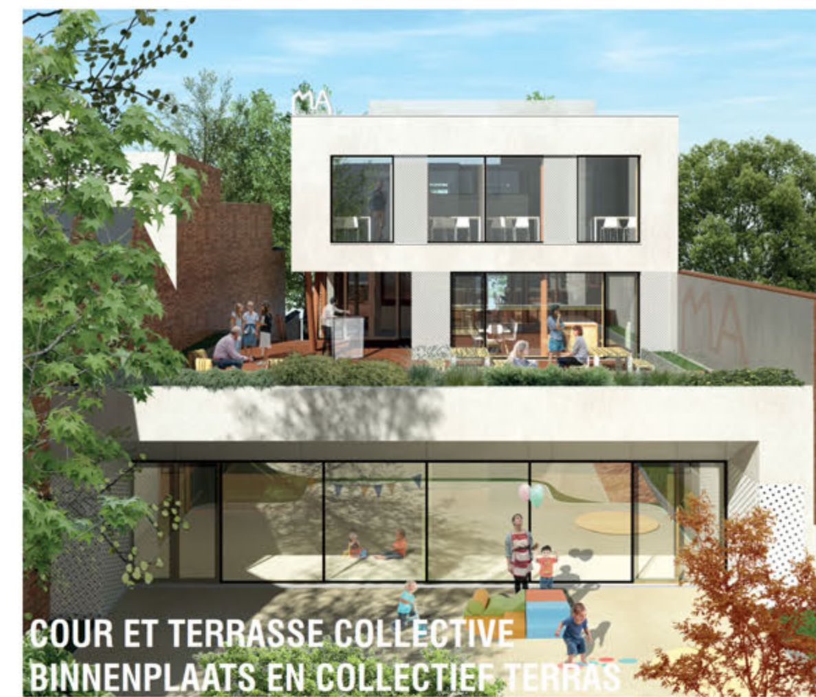
COUR ET TERRASSE COLLECTIVE BINNENPLAATS EN COLLECTIEF TERRAS