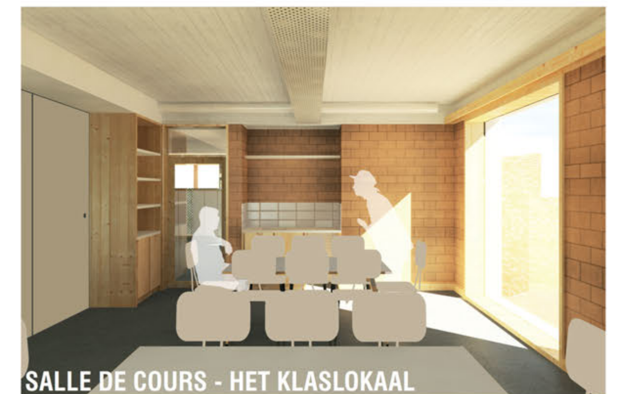
SALLE DE COURS - HET KLASLOKAAL