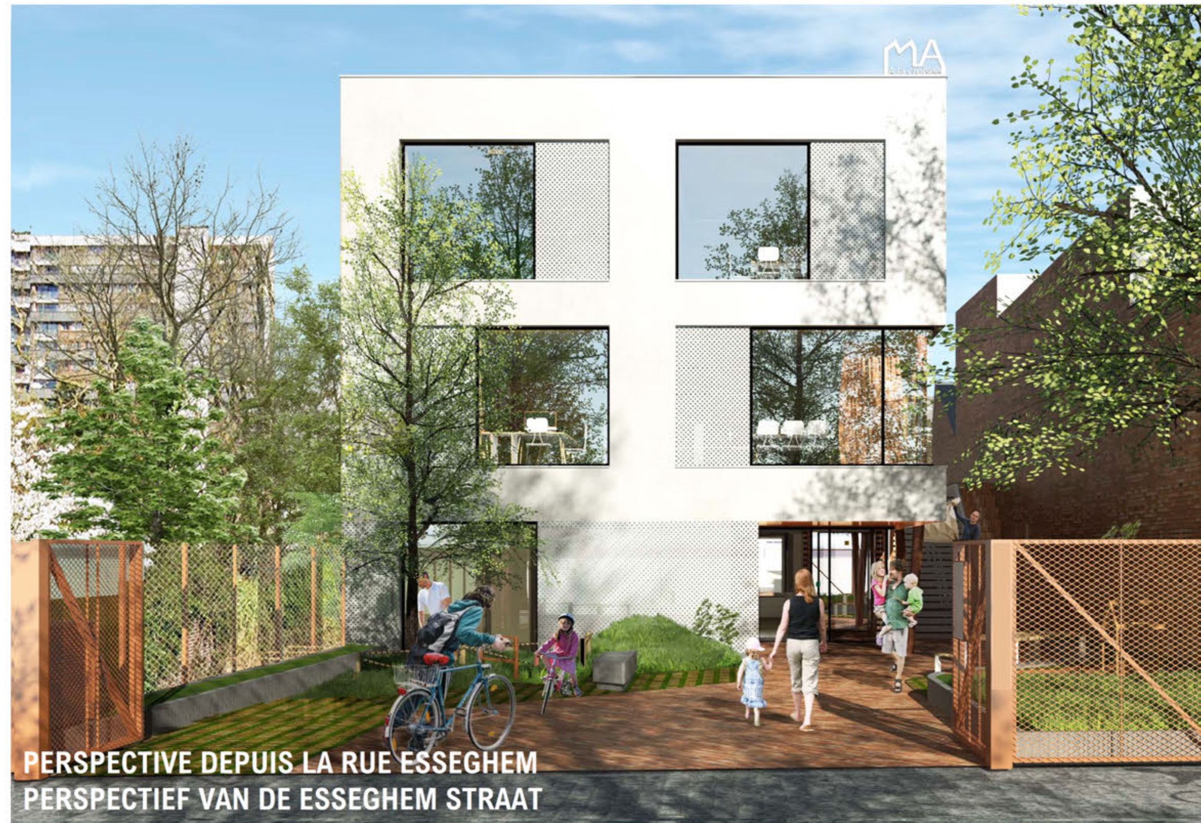
PERSPECTIVE DEPUIS LA RUE ESSEGHEM PERSPECTIEF VAN DE ESSEGHEM STRAAT