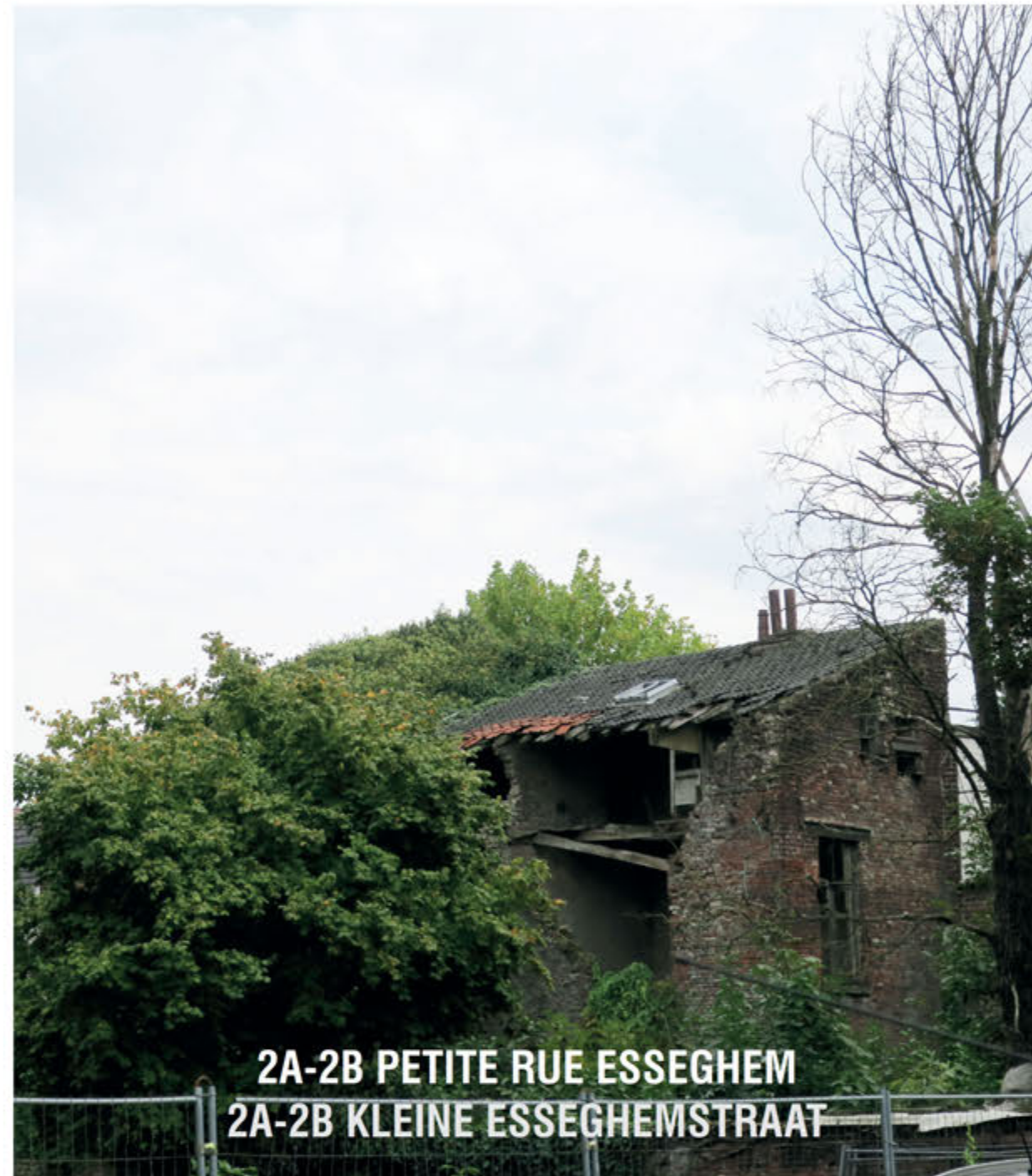
2A-2B PETITE RUE ESSEGHEM 2A-2B KLEINE ESSEGHEMSTRAAT