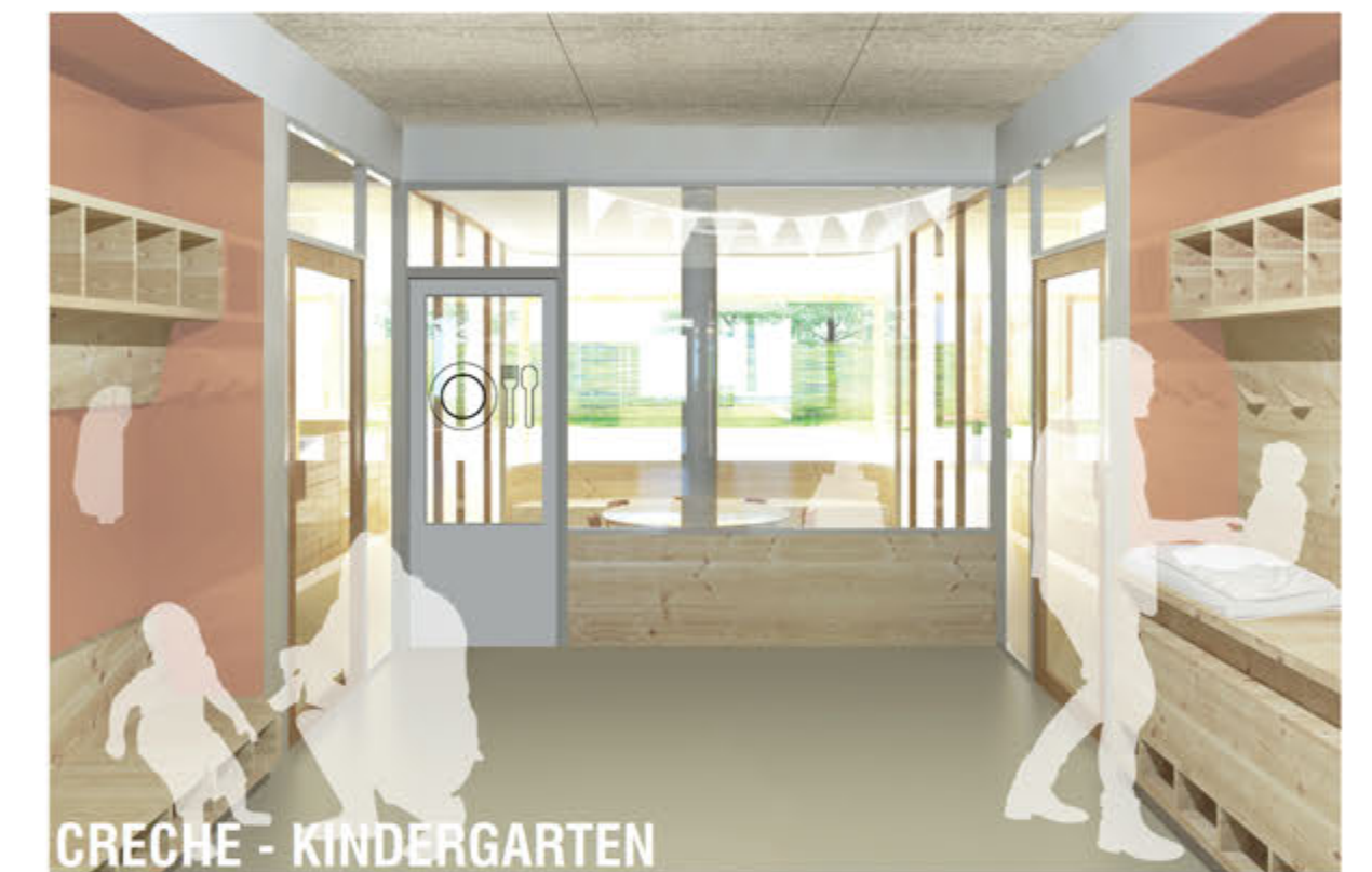
CRÈCHE - KINDERGARTEN