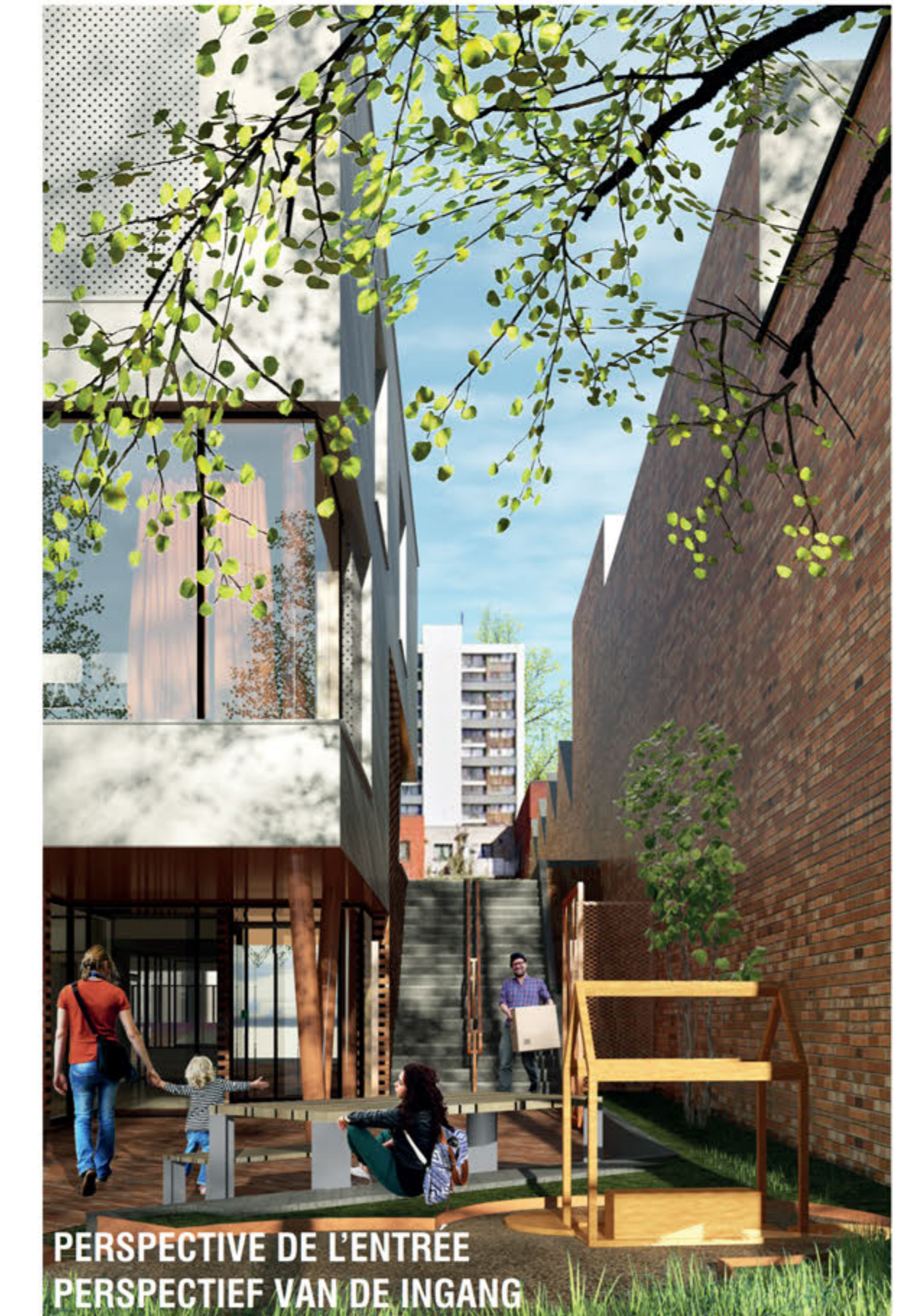
PERSPECTIVE DE L'ENTRÉE PERSPECTIEF VAN DE INGANG