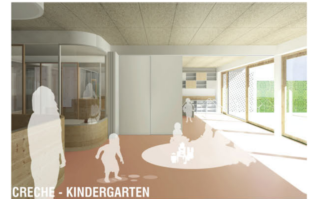
CRÈCHE - KINDERGARTEN